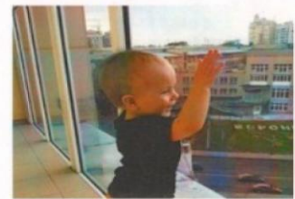
Вместе сохраним здоровье детей!

Не теряйте бдительность, объясните ребенку, что опираться на окна нельзя, а тем более высовываться наружу.